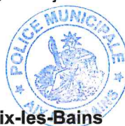
Le Maire d'Aix-les-Bains Renaud BERETTI